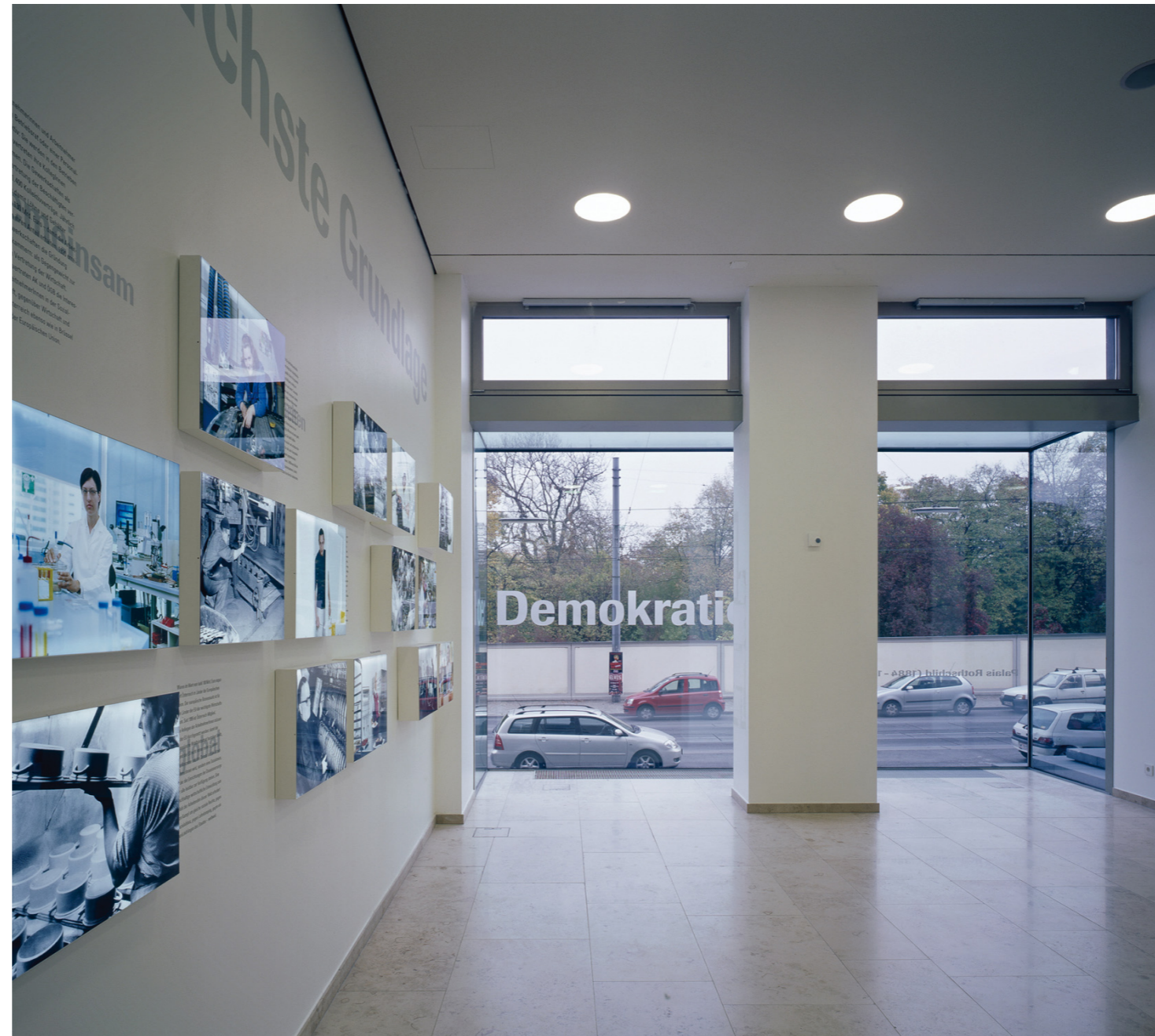
innen / außen ein umlaufendes zitat hält die komposition zusammen und bringt die ausstellung über den glaskubus in den außenraum.