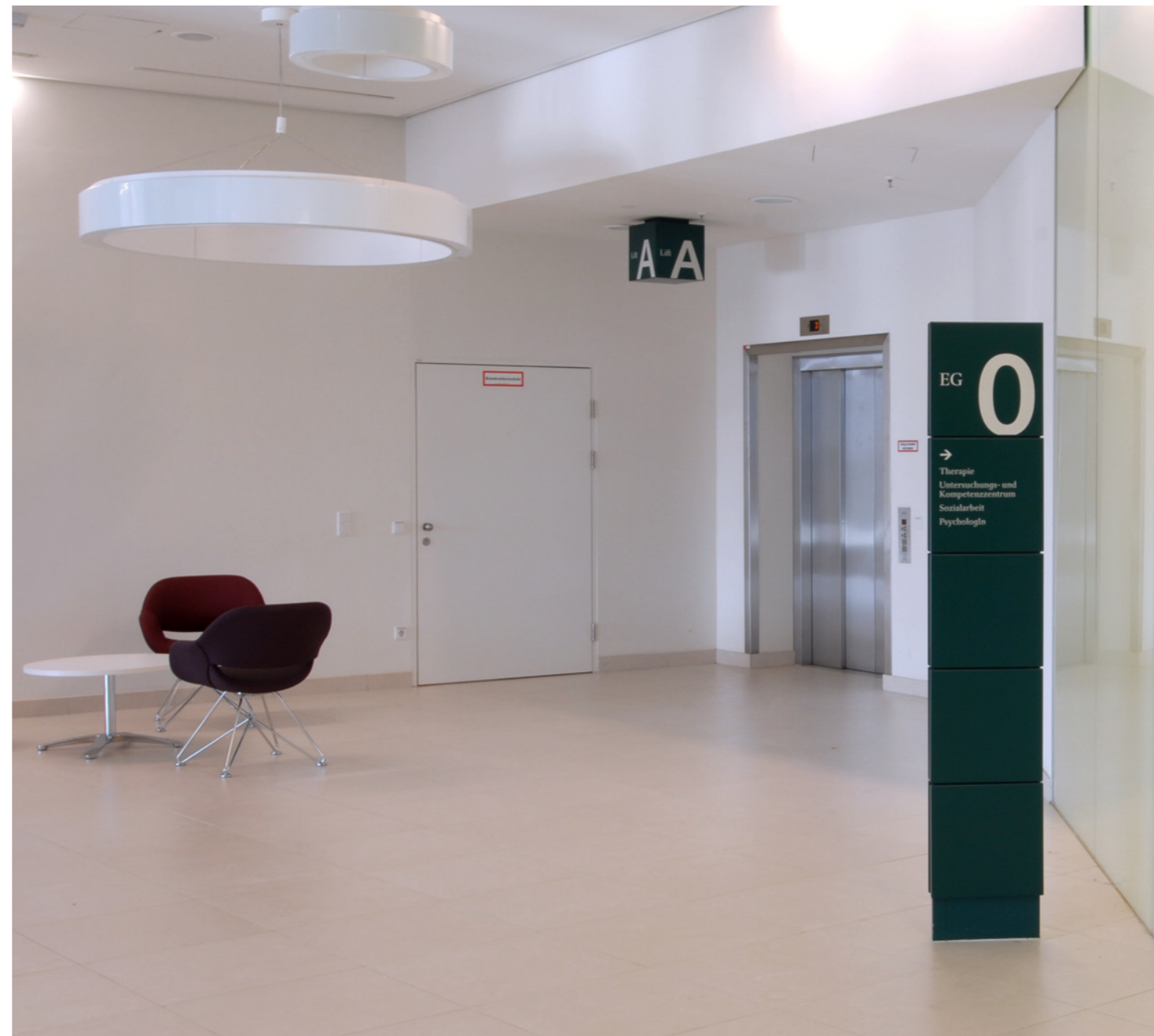
pflgewohnhäuser leopoldstadt und simmering das quadrat ist ein richtungsloses element, hat aber einen hohen auf- merksamkeitswert.