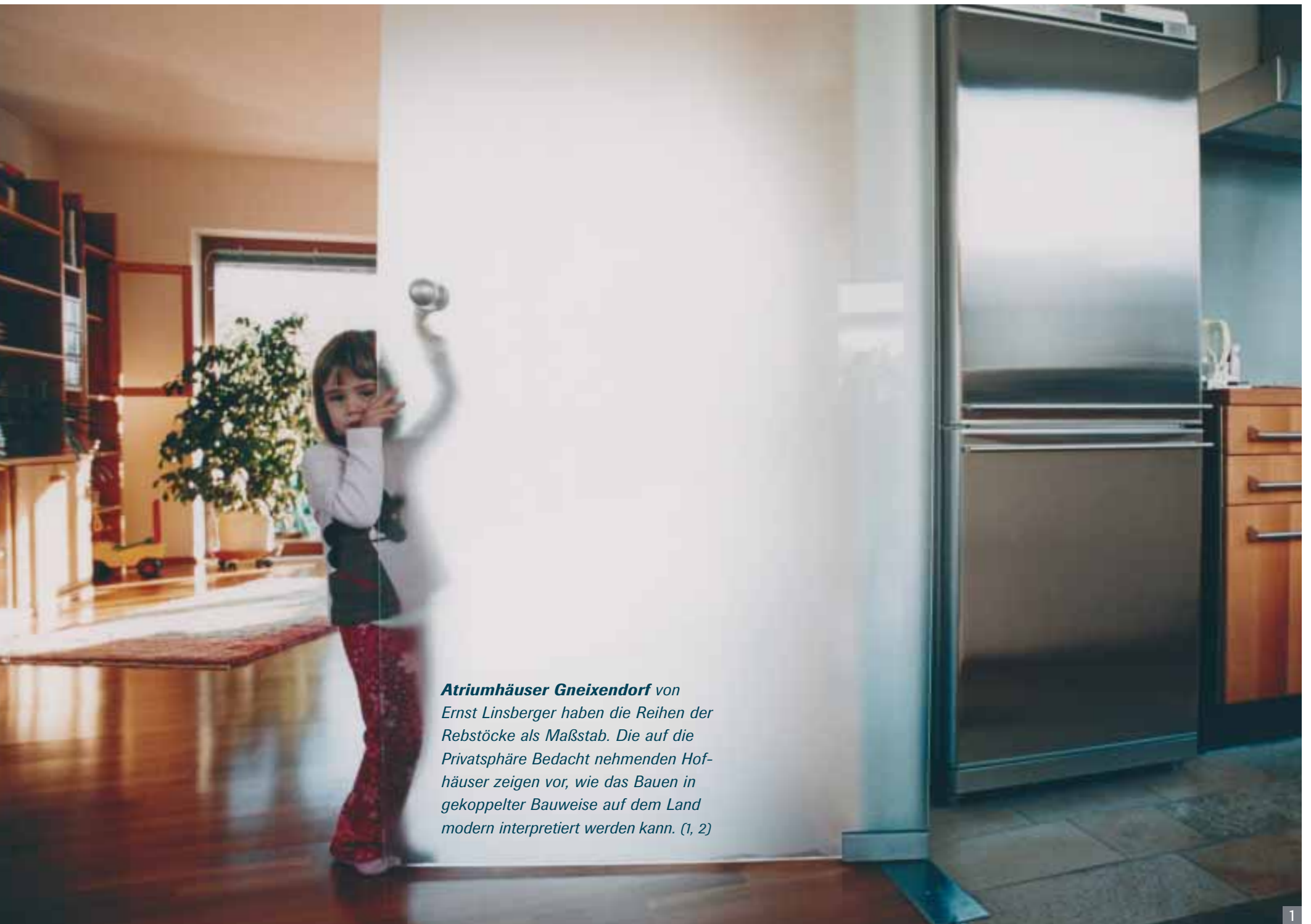
Atriumhäuser Gneixendorf von Ernst Linsberger haben die Reihen der Rebstöcke als Maßstab. Die auf die Privatsphäre Bedacht nehmenden Hofhäuser zeigen vor, wie das Bauen in gekoppelter Bauweise auf dem Land modern interpretiert werden kann. (1, 2)